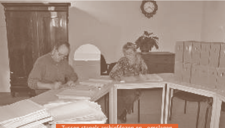
Tussen stapels archiefdozen en - omslagen

den - en het beschrijven van enkele duizenden voorwerpen is een karwei dat jaren in beslag zal nemen. Belangrijk onderdeel van dat traject vormt de aanpassing van de website van Klooster Sint Aegten, zodat de collecties via internet doorzoekbaar worden.