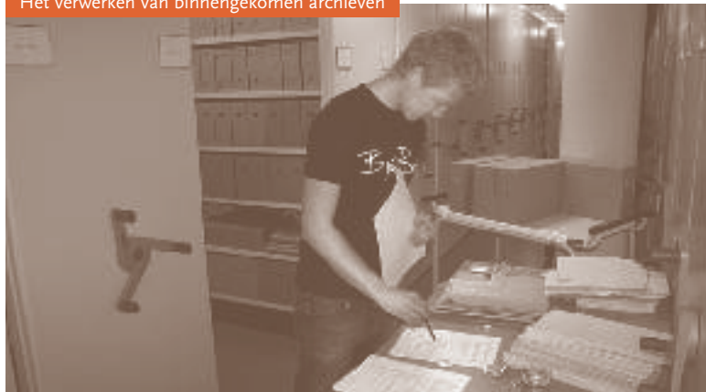
Het verwerken van binnengekomen archieven

De belangrijkste taak van het erfgoedcentrum in de eerstvolgende jaren is het opnemen en toegankelijk maken van het erfgoed dat naar St. Agatha wordt overgebracht, een arbeidsintensieve aangelegenheid. Archiefbeschrijvingen moeten worden overgezet naar het computersysteem van het centrum, de verschillende ordeningen van die beschrijvingen worden op elkaar afgestemd, de codering op archiefstukken en -dozen moet worden aangepast, en alle archieven worden voorzien van een beknopte inleiding ten dienste van gebruikers. Ook het toegankelijk maken van de bibliotheek - op dit moment al ca. 30.000 ban-