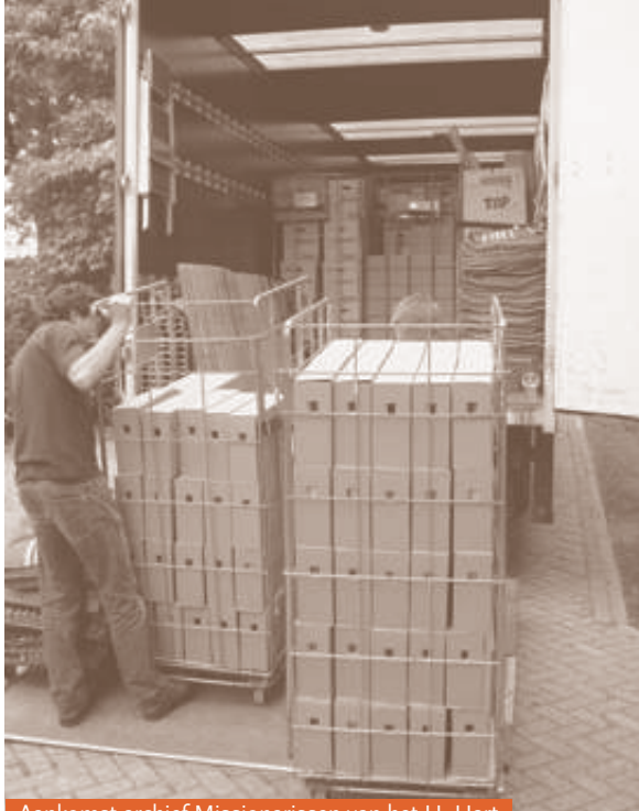
Aankomst archief Missionarissen van het H. Hart