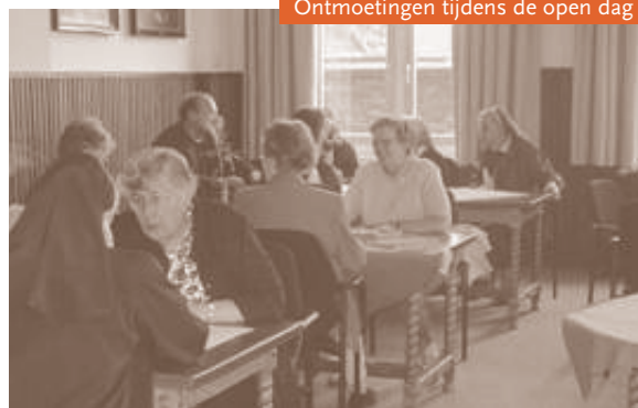
Ontmoetingen tijdens de open dag

De expositie op zolder is onlangs enigszins omgebouwd, zodanig dat ze nu aan bezoekers meer algemene informatie geeft over het kloosterleven. Het resultaat is dat er zes themata worden uitbeeld, die allemaal een kant van het kloosterleven belichten: kloosterleven als levenskeuze, het persoonlijk leven van een kloosterling ('leven alleen'), het leven in een gemeenschap ('leven met elkaar'), liturgie, bezinning en gebed ('leven met God'), dienstverlening aan de samenleving ('leven voor anderen'), en de veranderingen vanaf 1960. In korte teksten worden deze wezenlijke aspecten van het kloosterleven samenvattend beschreven en tegelijk met enkele voorwerpen toegelicht.