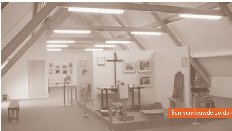
Een vernieuwde zolderetage