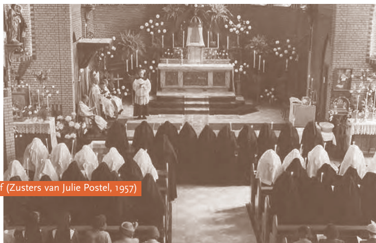
Novicen leggen de eerste geloftes af (Zusters van Julie Postel, 1957)

We hebben eerst alle ons bekende motieven voor de geloftes op een rij gezet. Iedere gelofte is in het verleden onderbouwd met aanbevelingen uit het Nieuwe Testament. De gelofte van armoede wordt bijvoorbeeld verbonden met aansporingen van Jezus om bezittingen van de hand te doen en te streven naar een schat in de hemel (Lc. 12, 33 en Lc. 18, 22). De gelofte van zuiverheid vindt in de traditie zijn