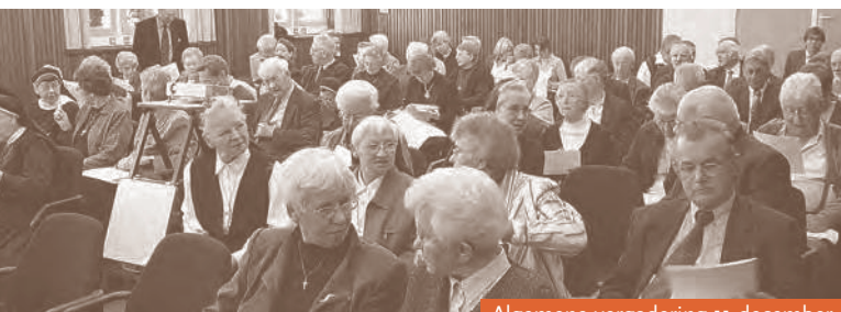
Algemene vergadering 11 december