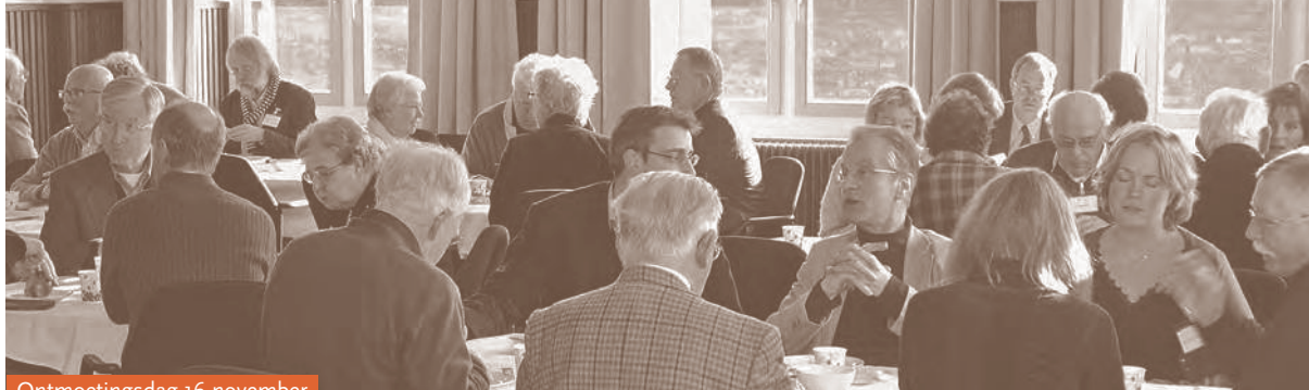
Ontmoetingsdag 16 november

De afgebeelde prent toont de geboorte van Jezus (onder), als onderdeel van de les waarin de kinderen leren dat - door zijn leven op aarde - alle mensen weer in de hemel kunnen komen (boven): "God de Vader strekt zijn armen uit... Kom maar! Jullie zijn weer mijn kinderen en mijn vrienden." > Otto Lankhorst