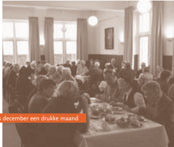
Voor de huishoudelijke dienst was december een drukke maand