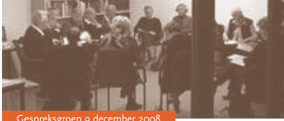
Gespreksgroep 9 december 2008