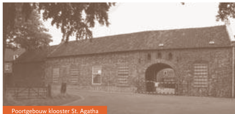
Poortgebouw klooster St. Agatha

Na een lange weg van overleggen, plannen maken en plannen bijstellen, is in december aan het aannemersbedrijf Van Niftrik uit Rosmalen de opdracht gegund voor de restauratie van het poortgebouw