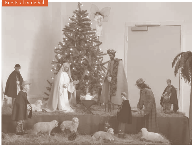
Kerststal in de hal

over het centrum zelf, zoals een lijst van de deelnemende religieuze instituten, de namen van bestuursleden en medewerkers en de Kronieken van de afgelopen drie jaar. Onder het kopje 'Kloosterleven' is informatie te vinden over het onderwerp dat in het erfgoedcentrum centraal staat: kloosters en kloosterleven in Nederland. Men kan hier doorklikken naar een tekst over kloosterlijke gebruiken en begrippen, naar een beknopte geschiedenis van het kloosterleven in Nederland en naar gegevens over het klooster van Sint Agatha. Dit alles met passende afbeeldingen uit eigen collecties geïllustreerd.