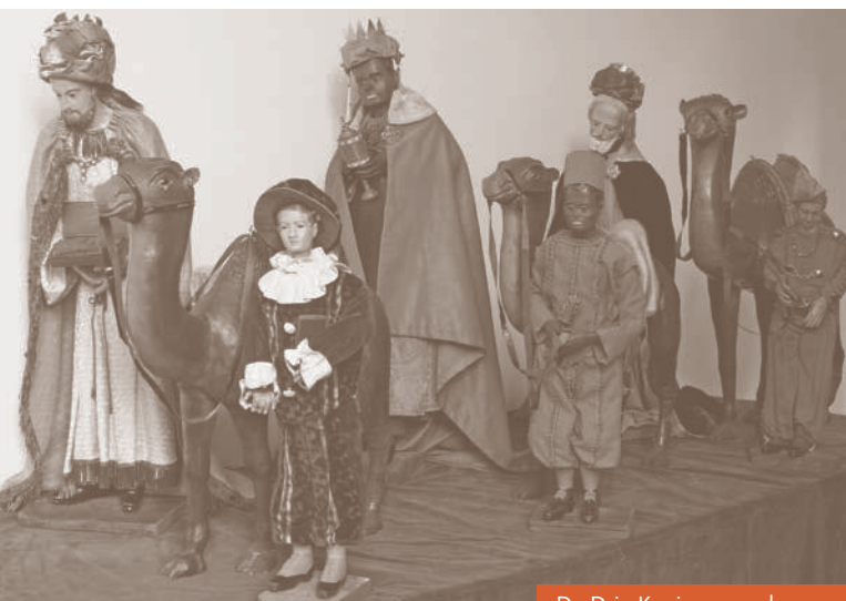
De Drie Koningen onderweg