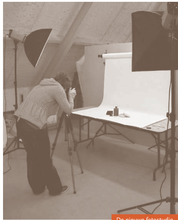
De nieuwe fotostudio