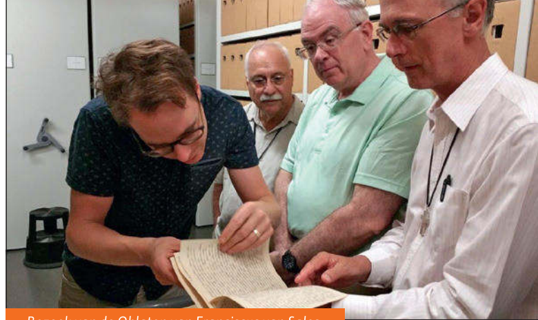
Bezoek van de Oblaten van Franciscus van Sales

In het verleden dienden de tekeningen de religieuzen bij de bouw en vernieuwing van hun kloosters. Nu helpen ze de huidige eigenaren vaak bij een omgekeerd proces: velen vragen om informatie over de oorspronkelijke staat van een gebouw. Bouwtekeningen en eventueel oude foto's kunnen hen helpen. Zo kwam er recent de vraag naar materiaal over het Missiehuis Driehuis van de Missionarissen van het Heilig Hart. Een van de potentiële kopers van het monumentale pand, met tuinen en boomgaard, wil aan het complex een herbestemming geven met respect voor de geschiedenis. Hij wil het historische pand recht doen qua uitstraling; het was bedoeld als een plek voor vorming en bezinning in een rustieke omgeving. De nieuwe bestemming zal 'een gemeenschap voor iedere levensfase' zijn. Om een goed onderbouwd plan te kunnen indienen, kwam hij naar onze studiezaal en vond de oorspronkelijke tekeningen van de bouw van het Missiehuis in de jaren 1922-1924 en die van de verbouwing in de jaren vijftig. Daarbij waren tekeningen en beplantingsschema's van de tuinen en de boomgaard, die kunnen helpen om de originele groenstructuur terug te brengen. Ook op oude foto's werden ontdekkingen gedaan over ruimtes die later verbouwd werden. In de komende jaren zullen ongetwijfeld nog meer kloosters een nieuwe bestemming krijgen en dientengevolge bezoekers naar de studiezaal brengen. > Otto S. Lankhorst