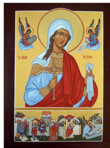
Icoon van Sint Agatha, door Liesbeth Smulders