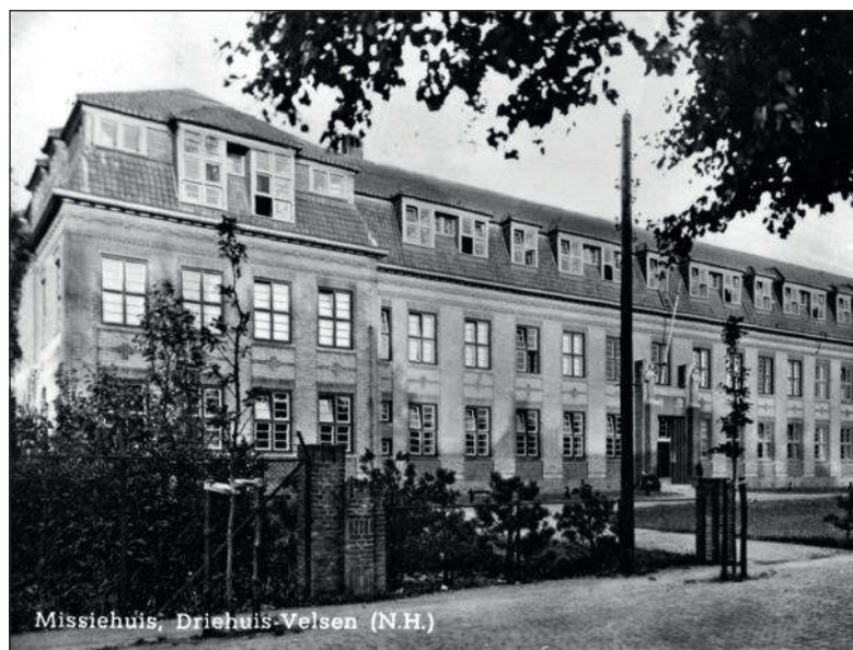
Missiehuis, Driehuis-Velsen (N.H.)